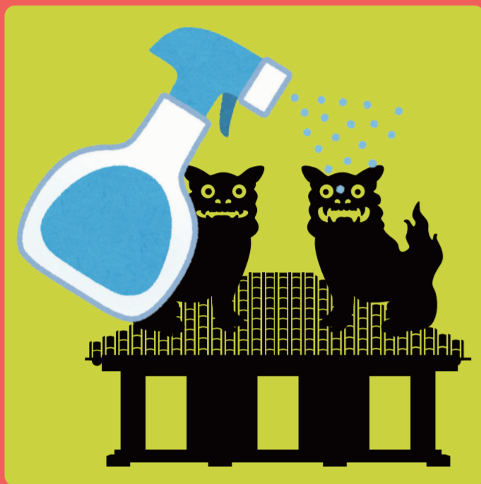
店・船・車・器材などの消毒